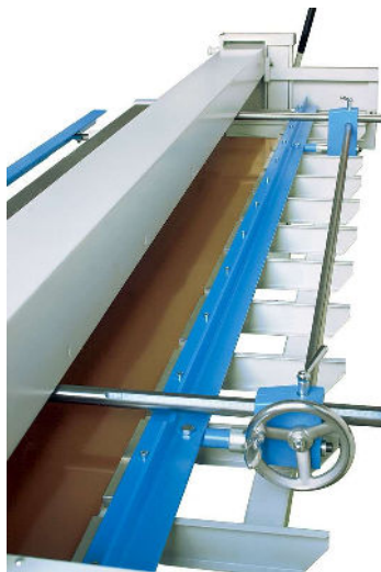
manueller Tiefenanschlag 0-750 mm mit Zahnstange, Kurbel + Kipptisch nach vorne ablegend