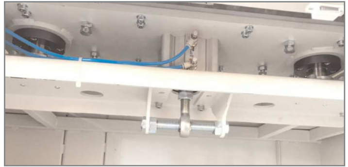
Magnete pneumatisch verfahrbar

Mit dem optionalen QuickFix Verschuß kann die Verrundungsdisc in Sekundenschnelle gegen eine Entgratdisc getauscht werden.