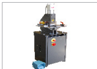
Schwerere Ausführung mit Hydraulikantrieb.