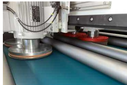
Vier rotierende und oszillierende Discs für 360° Bearbeitung

Kosten: Aufgrund des einzigartigen Konzepts kann auf teure Vakuum- und Magnetbahnen verzichtet werden, was die Investitionskosten niedrig hält. Bei den Betriebskosten überzeugen der niedrige Stromverbrauch aufgrund geringer Anschlußleistung sowie der günstige Schleifmittelverbrauch.