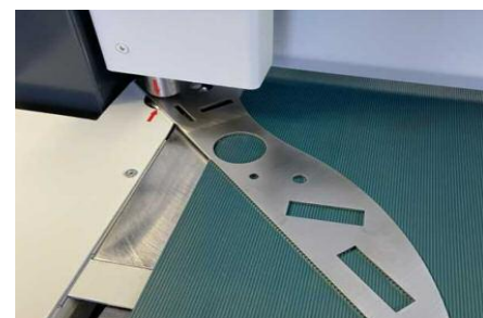
Motorische Blechdickeneinstellung, optional mit automatischer Abtastung