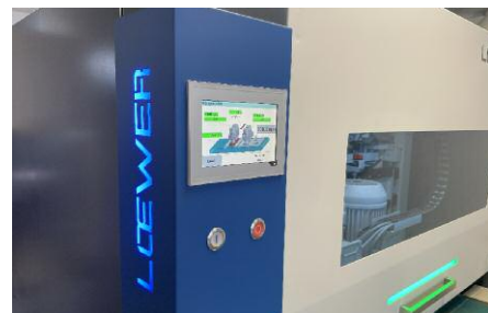
Optional mit Touchpanel Steuerung