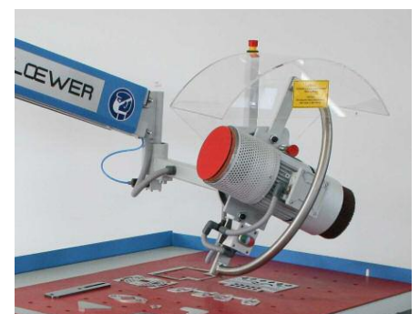
Schwenkbarer Schleifkopf 180 Grad für schnelle Verfügbarkeit von Entgrat- und Verrundungswerkzeug